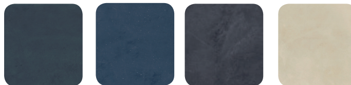
09. Zinc 10. Steel 13. Carbon 16. Limestone