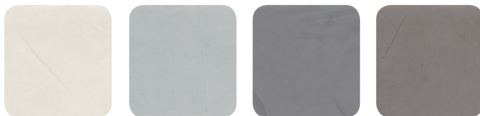
1. Titanium 2. Aluminium 3. Stainless Steel 4. Lead