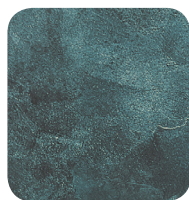
5. VERT DE GRIS